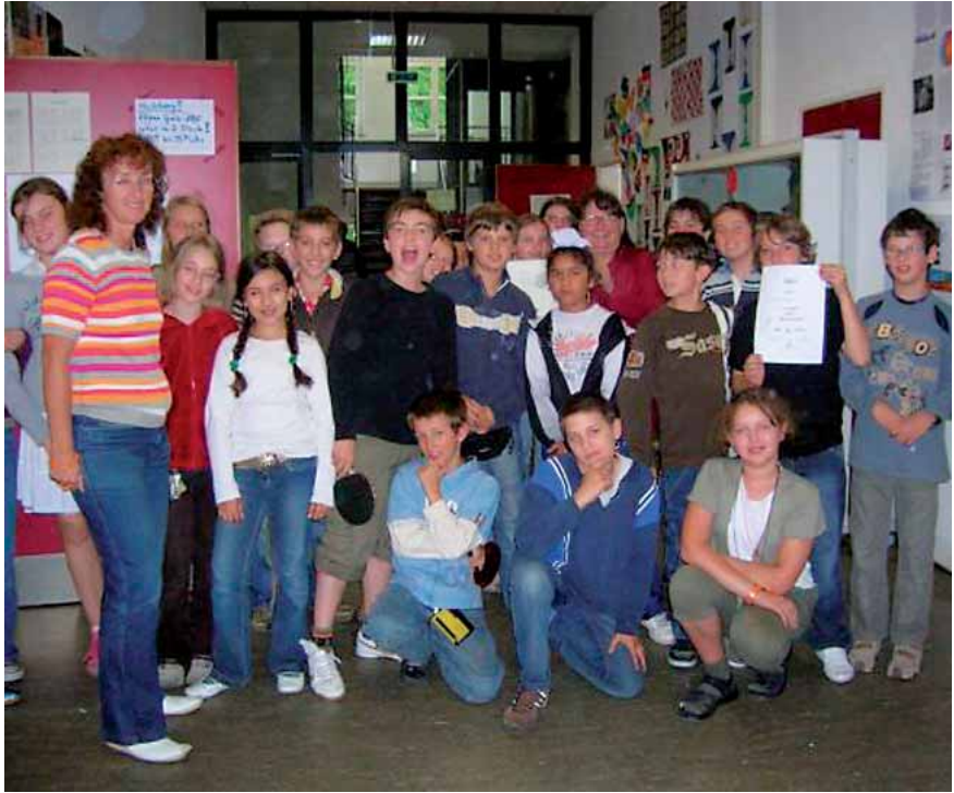
Eine der fünften Klassen der IGS Nordend nach dem Sponsorenlauf

Einige Unterstützerinnen haben uns geschrieben, wie wichtig ihnen das Projekt und die Lektüre der Broschüre ist, dass sie aber aus finanziellen Gründen nicht mehr spenden könnten und deshalb aus der Kartei gestrichen werden wollten. („Genau das ist es, was das Altern schwer macht: Etwas nicht weiter unterstützen zu können, was einem wichtig ist“, schrieb eine Spenderin). Natürlich senden wir allen Interessierten unsere Informationen gerne weiterhin zu.