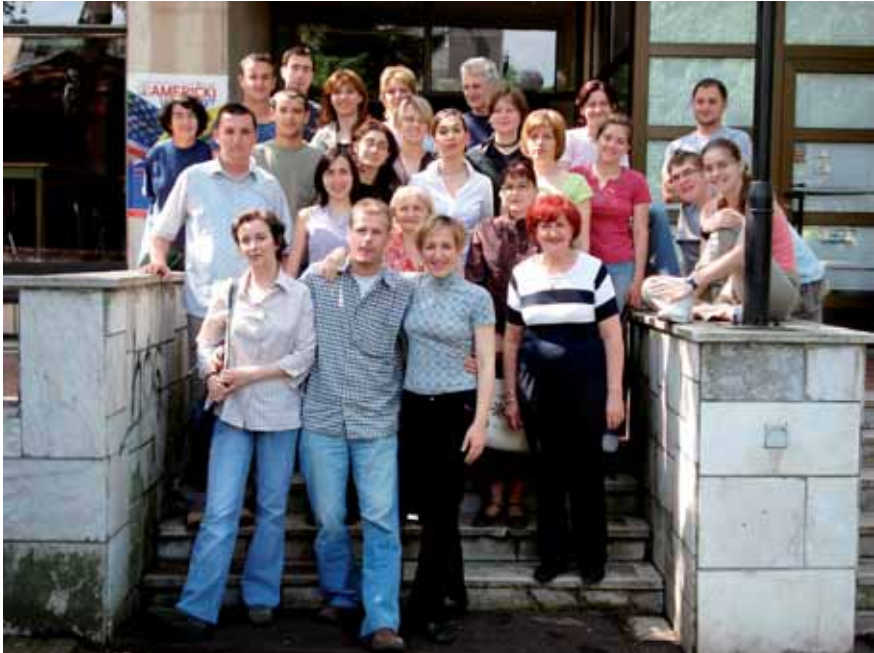
Einige BetreuerInnen bei der Vorbereitung in Tuzla

MitarbeiterInnen bei den Freizeiten mit Jugendlichen aus Bosnien, Kroatien und Serbien in Neum/Bosnien: