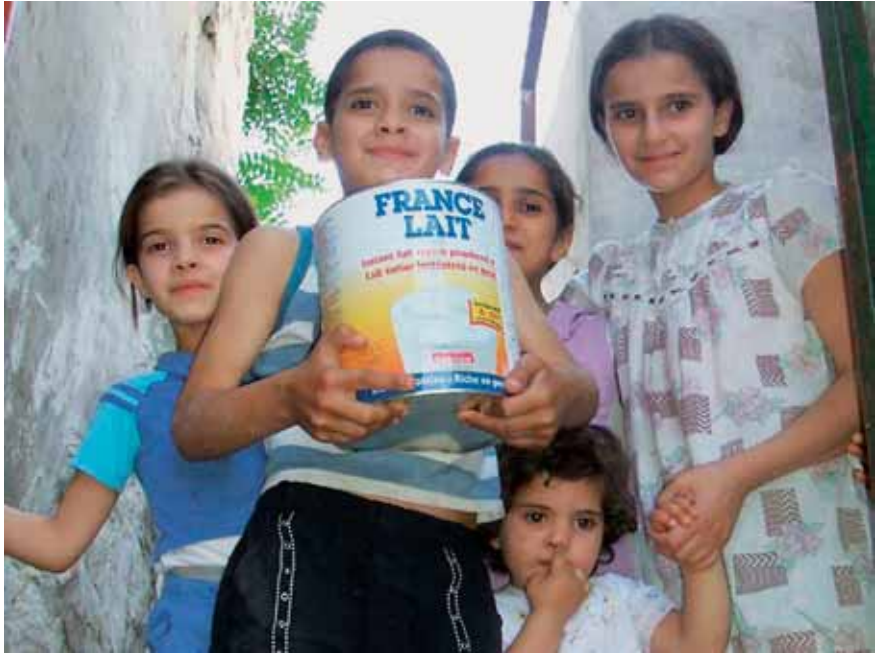
Kinder bei den Ferienspielen in Nablus

York, das Geld sei von den US-Behörden im Rahmen der Terrorismusbekämpfung beschlagnahmt worden. Das Komitee konnte durch einen Vertrag beweisen, dass die Ferienspiele neben der Erholung vor allem der gewaltfreien Erziehung und Aussöhnung dienen sollten. Darin heißt es ausdrücklich: „Die Ziele des Konzepts sind Erholung und kreative Beschäftigungen sowie gleichermaßen pädagogische Methoden der gewaltfreien Erziehung, Aussöhnung und Demokratie. Das bedeutet auch, dass Kämpfe und Wettbewerbe ebenso wie die Erziehung zu Hierarchien („education for leadership“) oder die Verehrung von Helden oder Märtyrern nicht Inhalt des Programms sind.