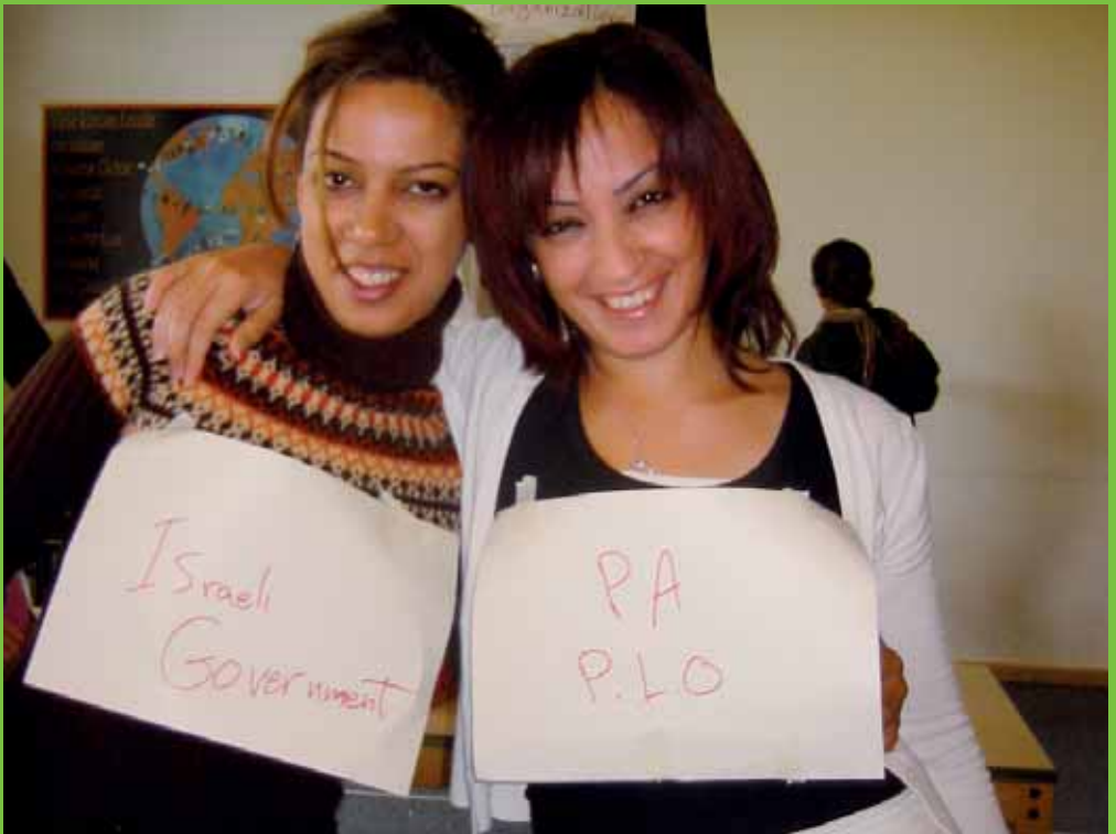
Frauen aus Israel und Palästina bei „Friedensverhandlungen“