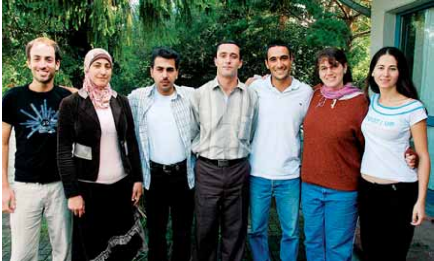
Die „Delegationen“ beider Seiten

vielleicht ist es als Person einfacher und nicht so gefährlich wie in der Gruppe. Wir denken auch daran, bei den israelischen Behörden Besuchsgenehmigungen für ein Gruppentreffen zu beantragen und dazu eine Art Bürgschaft zu übernehmen. Wir wollen es versuchen. Wenn wir hören, dass etwas Schreckliches in Ramallah, Jenin oder an anderen Orten passiert, werden wir gleich anrufen und fragen: „Was ist los? Bist Du okay?“