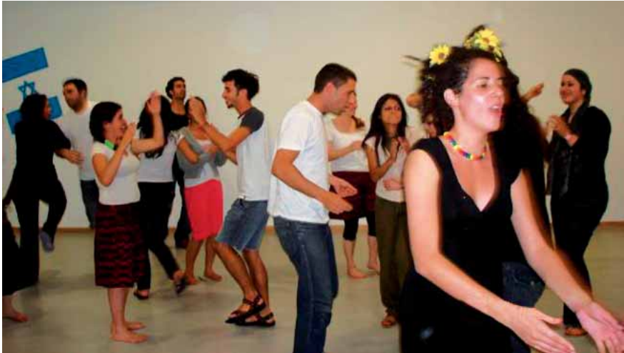
Disco beim israelisch-palästinensischen Seminar

denen die Teilnehmer über die Realität und Fakten reden können, so wie in dem historischen Workshop und dem über Friedensverhandlungen.“