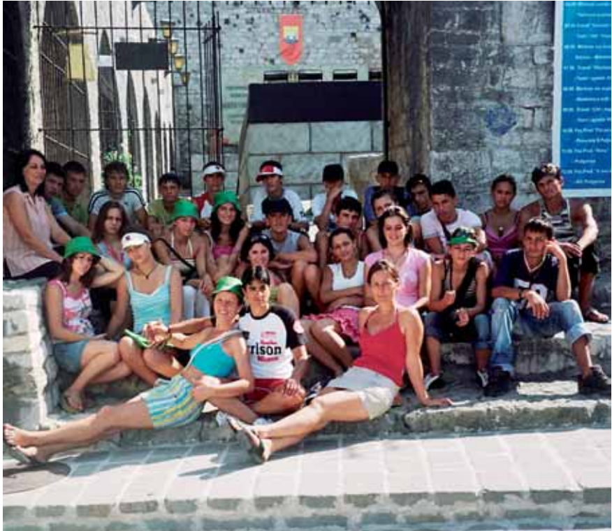
Jugendliche beim Sommercamp in Ulcinj

Obwohl bei der Abschiedsparty alle sangen und tanzten, war die Stimmung traurig. Alle tauschten Telefonnummern und e-mail-Adressen aus, versprachen einander, in Kontakt zu bleiben, und verabredeten ein Wiedersehen. Kurz darauf fuhren die albanischen und Roma-Jugendlichen nach Velika Hoca, wo sie einen Tag mit den serbischen FreundInnen verbrachten, was im Kosovo mehr als ungewöhnlich ist. Sie tauschten Fotos und Erinnerungen aus und waren zufrieden und stolz auf ihre gemeinsamen Erfahrungen.