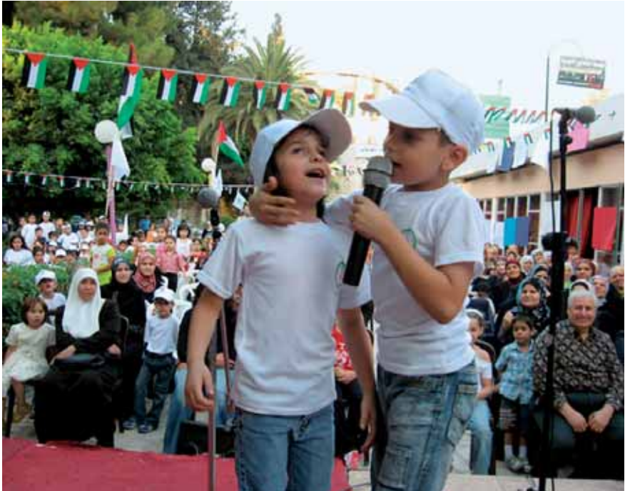
Bei den Ferienspielen in Nablus

Das Wort ‚Leiden‘ klingt bereits abgedroschen, aber wie kann man die Situation von Kindern beschreiben, die die Geräusche von Panzern und Kugeln besser kennen als das Singen von Friedensliedern?“